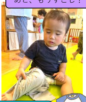
ぼくたちやればできるもん(*´▽`*)!