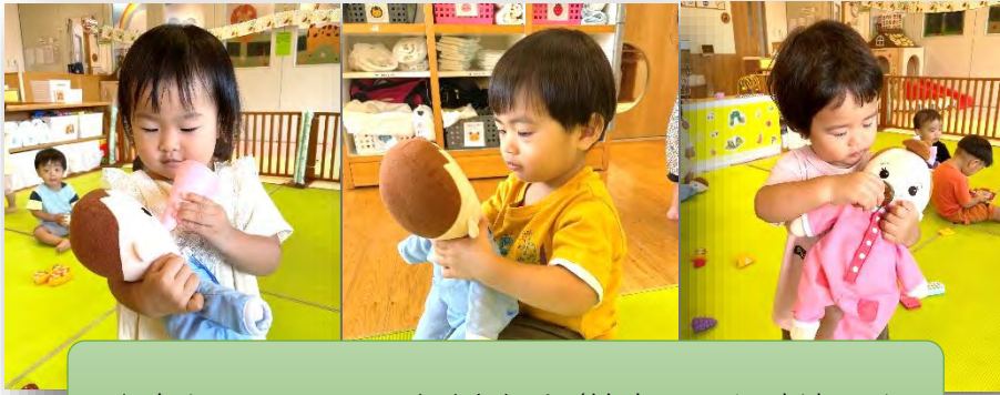
↑赤ちゃんのお世話が大好き/絵本にも興味津々↓