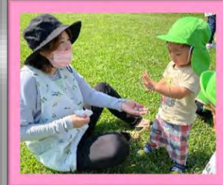
❁園外活動も楽しんでます❁